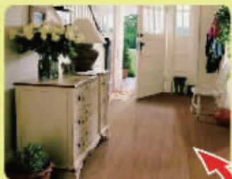
圣象地板 产品名:塔克马橡木 巢尚直供价:65元/平米