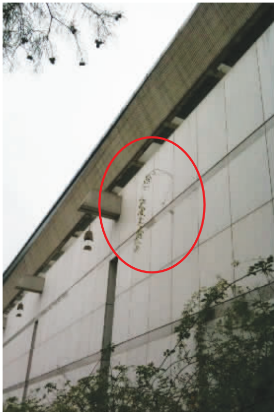
在看上去不可能存活的地方,这株藤蔓不但扎根发芽,而且活得还不错。10月27日摄于南京古生物博物馆 (作者杨荣良获30元话费)