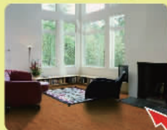
大卫地板 产品名:水晶橡木 巢尚直供价:105元/平米