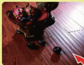
久盛地板 产品名:栎木仿古 巢尚直供价:340元/平米