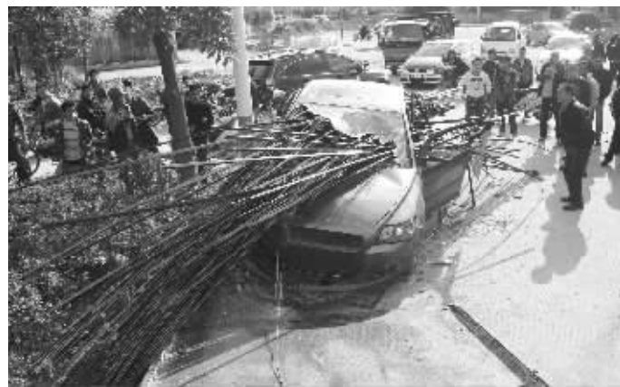
▲上图:上百根钢筋刺入轿车