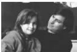
乔布斯和女儿丽萨

但是到2011年7月,他的癌细胞已经扩散到骨骼和身体的其他部分,而医生们难以找到对症的药物去治疗。他很疼,筋疲力尽,不得不停下工作。他和鲍威尔之前还预订了一艘帆船,准备那个月底全家去航海,但是这些计划都搁浅了。那段时间,他已经基本上不能吃固体食物了,每天大部分时间都在卧室看电视。