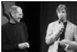
乔布斯与拉里·佩奇