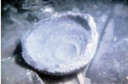
疑似元军战舰发射的炮弹残片