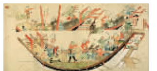
《蒙古袭来绘词》中描绘的元军战舰

1292年,日本镰仓幕府武士竹崎季长为使自己的武功为幕府和后人所知,请画师根据他在战场上的亲身见闻,详细描绘了元军铁火炮炸裂、元军战舰和元日双方交战的真实画面。这便是著名的《蒙古袭来绘词》,又叫《竹崎季长绘词》。竹崎季长后来因此获得封官加赏,并被赐了一匹骏马。而《蒙古袭来绘词》也成为后人研究“蒙古袭来”战争的珍贵的第一手资料。 综合