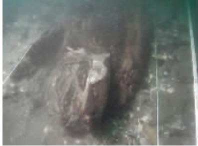
疑似元军战舰的龙骨部分