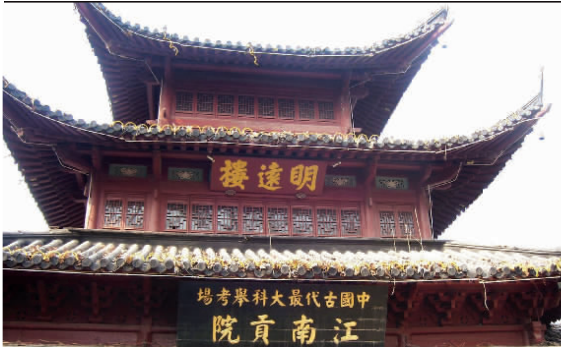
明朝科举考场——江南贡院 本版均为资料图片