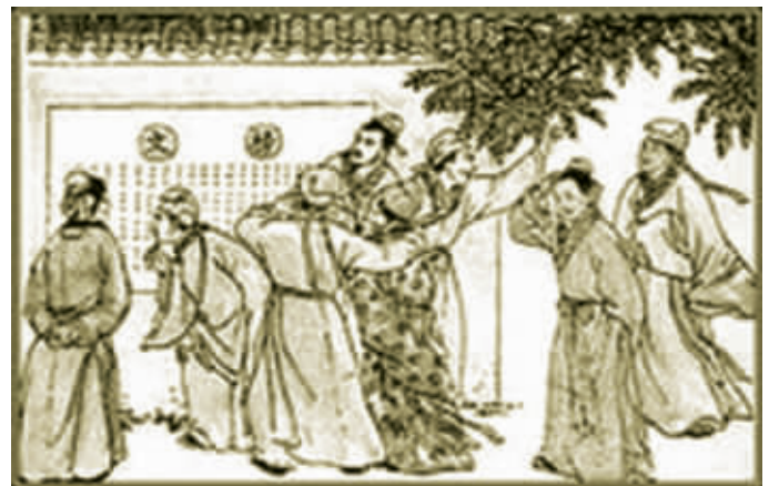
古代科举放榜情景图

除却上面所说的政治目的,还有一个由来已久的问题:中国科举制度的“南北矛盾”。这个矛盾还要追溯到宋朝。北宋的科举,素来“重北轻南”,北宋真宗以前,所有的宰相都是北方人。南北方考生