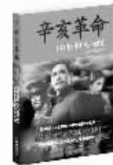
《辛亥革命》 作者:王兴东 陈宝光 重庆出版社 定价:32.00元

本书是辛亥革命一百周年纪念电影剧组独家授权的小说完整版,真实展现了辛亥革命波澜壮阔的史诗场面,生动刻画了孙中山、黄兴、徐宗汉等历史风云人物。