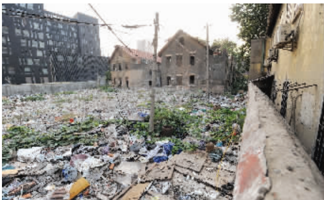
闲置已久的黄金地块位于金陵中学东南侧