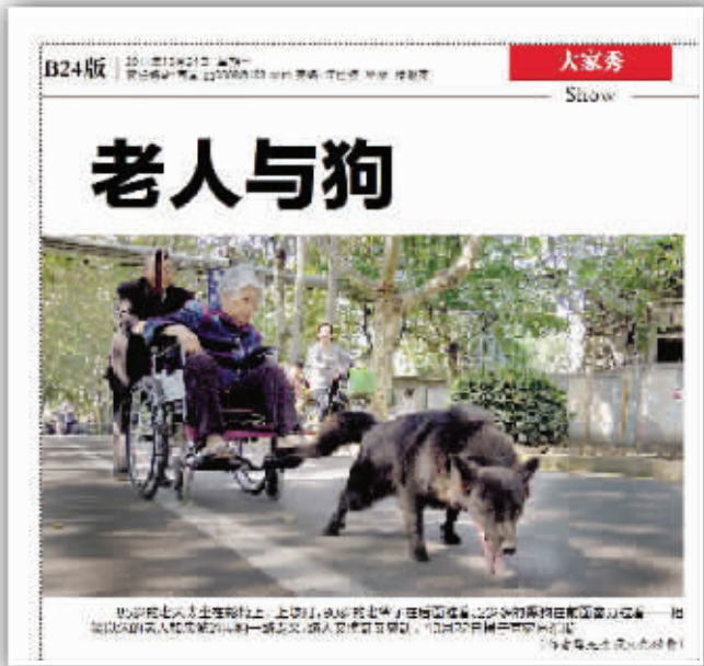
昨天快报的“大家秀”版面截图