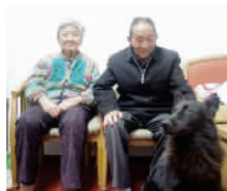
黑犬贝贝,很像一个忠诚卫士