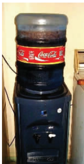
看看人家公司的福利