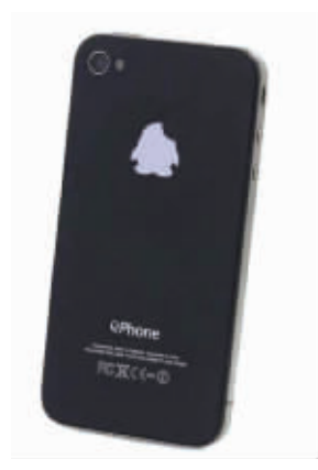
总有一天,企鹅会出手机的