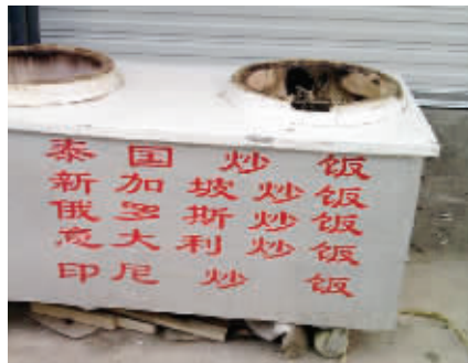
传说中的世界五大“炒饭系”