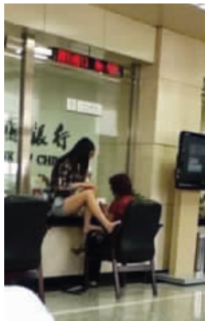
你这是上惯了炕了吧