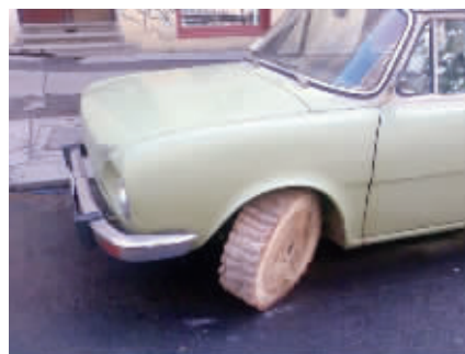
亲爱的,我把轮胎换好了