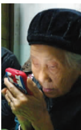
奶奶,你微博账号叫啥