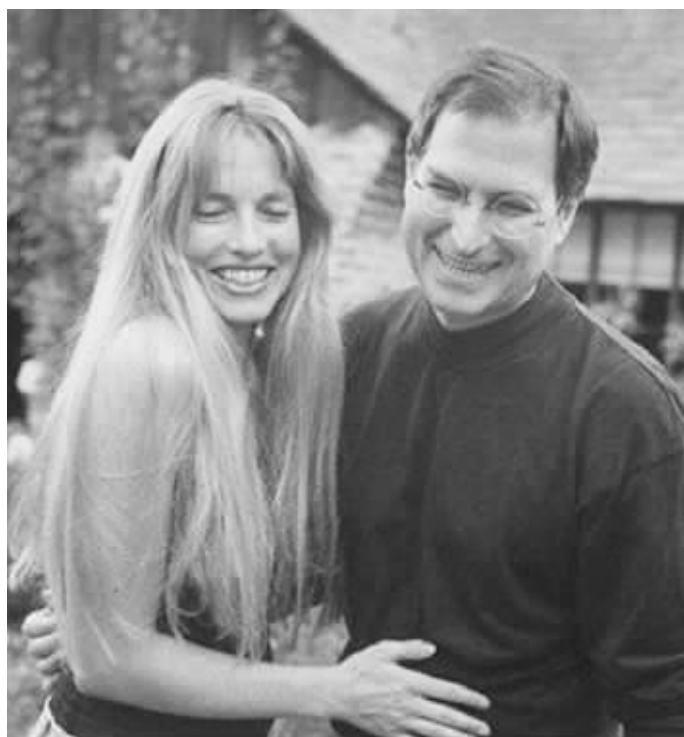
年轻时的乔布斯和劳伦·鲍威尔

根据乔布斯的恋爱史,做红娘的应该可以大概勾勒出适合乔布斯的女人了:聪明,而不自负,足够刚强能承受跟他在一起的压力,又足够超脱能免于争端;受过良好教育,独立,又愿意为他和家庭而作出改变;能适应现实,却又带着点儿超凡脱俗;足够世故知道怎么管理他,又有足够的安全感不用总是管着他;当然最好还是个漂亮苗条的金发美女,平易近人,有幽默感,喜欢有机素食。