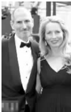
乔布斯与劳伦·鲍威尔

鲍威尔的怀孕并没有彻底解决这件事。乔布斯又开始为结婚这个念头犹豫不决,虽然他在1990年的年初和年终都那么戏剧性地求婚。鲍威尔愤怒地从他家搬回了自己的公寓。