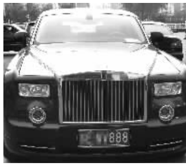
前来参加“村长”论坛的各地豪车