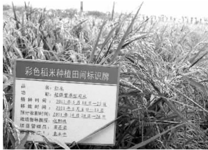
严清华多次找到省农科院，彩色稻米项目终于落户黄金村村