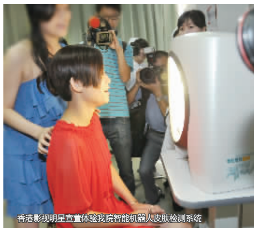
香港影视明星宣萱体验我院智能机器人皮肤检测系统

还原皮肤本色,让皮肤纯净自然。智能机器人皮肤检测系统可以让加班、熬夜、操劳、环境、光老化、妊娠等因素引起的皮肤衰老逆转,重返弹性、鲜嫩、白皙的状态。