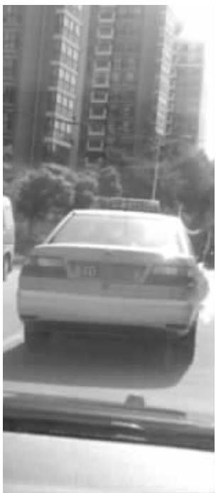
网友发图“通缉”的哥

网友“莽山蟾蜍”的帖子发布于昨天上午，标题很引人注目，叫《全城通缉常州无良出租车司机，撞到学生后驾车逃逸》。帖子里说：“昨天中午陪朋友去办事路过学校门口见到一幕，太可气了，无良的出租车司机撞上一骑电动车的学生后不停直接开走了。我和朋友刚好开车路过，紧追上去，不过没办法技术有限，比不过人家。”