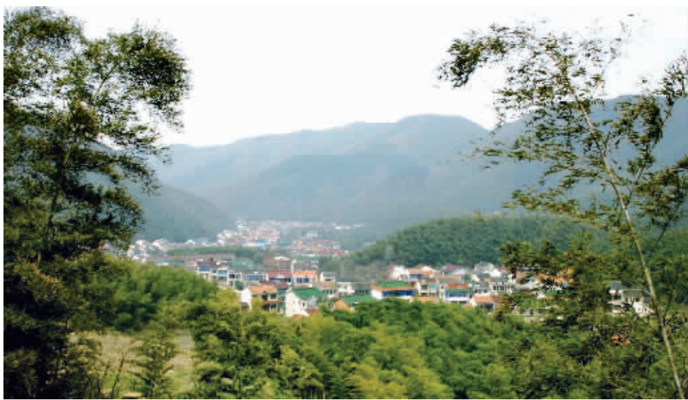
中国最美的乡村有一个就在宜兴境内

众口成碑的一流生态环境如今已成为宜兴人民最引以为豪的一笔财富。目前宜兴已经开创了一条“以环境优化增长,以发展提升环境”的科学发展新路径,舍得在生态建设上投入巨资是宜兴生态环境一年比一年美丽的主要原因。据了解,近年来宜兴在环境基础设施上累计投入资金43亿元,占同期地方财政一般预算收入的40%,构建了省内一流的环境基础设施体系。龙背山森林公园、团氿湿地公园,以绿色为主题的东氿新城已累计完成基础设施投入60多亿元,其中相当一笔投资用于东氿公园等绿色