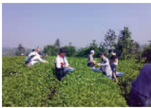
善卷洞(左)、阳羡茶、中国陶瓷博物馆都是宜兴的名片 资料图片