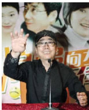
范明