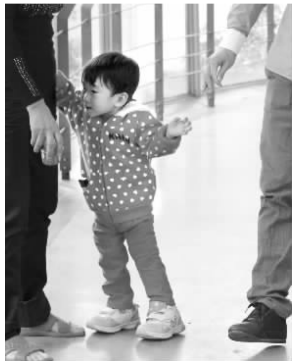
尽管可以慢慢地走路了,但和别的小朋友一样,小伊伊时不时撒着娇要人抱(10月18日摄)。