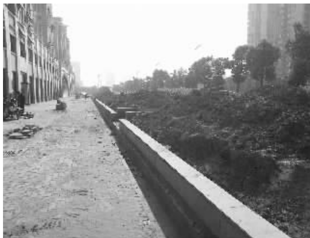
树没了,土被重新翻过

改建后的星港大道宽阔平坦,道路两旁绿树成荫。然而,最近一段时间,不少经过那里的市民发现,在靠近港龙华庭小区附近一段长约200米的人行道上,上百棵行道树不见了。为此有市民猜测,可能是因为行道树太密,遮挡了港龙华庭沿街商铺,才会遭此“厄运”,并质疑这么做是否得到绿化部门的批准。具体是怎么回事,快报记者昨日进行了调查采访。