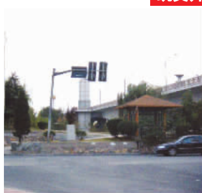
丁字路口的红绿灯,竟然拿“屁股”对着路口。交警叔叔,这玩笑开大了。10月15日摄于下关大桥 (作者赵萍获30元话费)