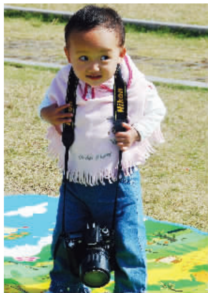
不要在乎用什么工具钓鱼,开心就好。10月16日莫愁湖公园 (作者思成公主获30元话费)