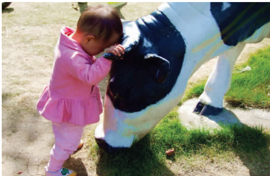
初生牛犊不怕虎,更不怕奶牛。顶牛,看这样子,双方打了个平手。10月15日摄于绿博园 (作者武文磊获30元话费)