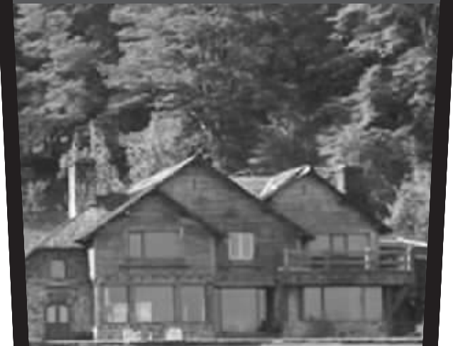
据称希特勒就曾生活在这幢阿根廷庄园住宅中