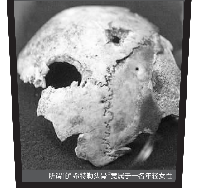
所谓的“希特勒头骨”竟属于一名年轻女性