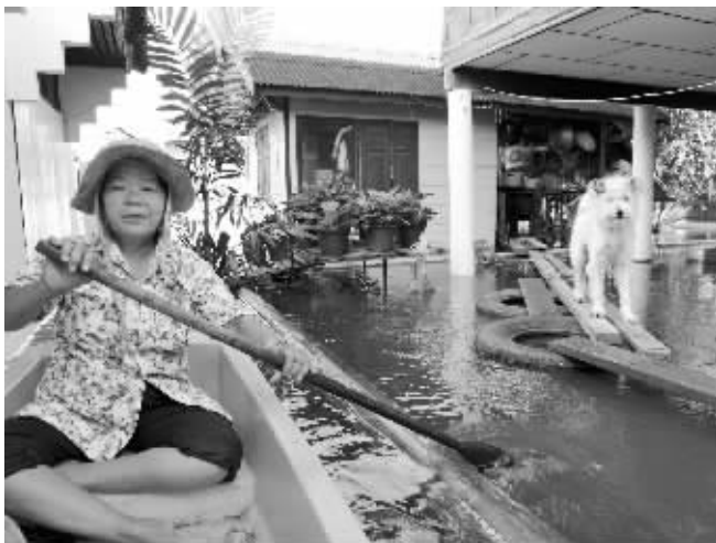
曼谷市外围的村民在被淹的房屋间划行