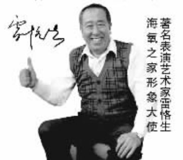
著名表演艺术家雷恪生 海氧之家形象大使

咨询电话:025-68863916 68863922 总店地址:江苏省南京市秦淮区马道街106号