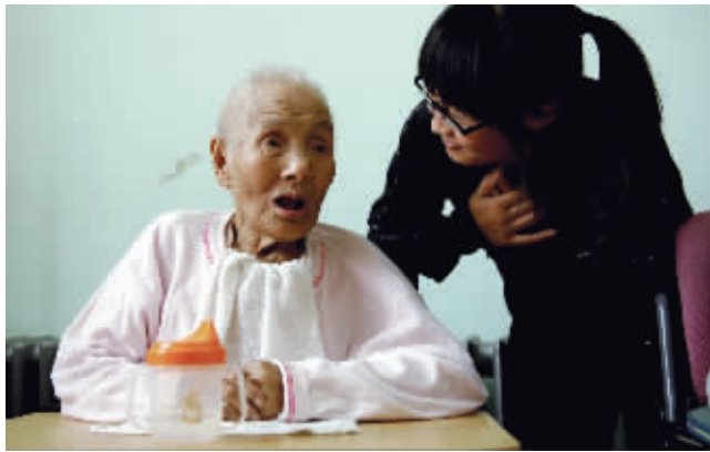
抽点时间多陪老人聊聊天