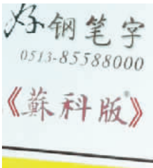
原告公司内部刊物上的“苏科版”字样