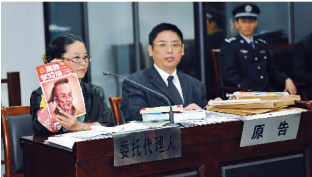
庭审现场,陈女士拿出一些教辅书籍作为证据