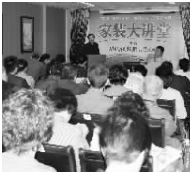
家装课课通第一课现场爆满

装修要学习的内容很多,光看一些资料是远远不够的。10月22日,快报家居家装课课通第二堂课将准时开讲。第二堂课的专家将针对如何看清装饰公司报价、施工做到什么程度才算合格等进行讲授,届时,还将有两位设计大师专门针对大户型进行解析,让您快速晋级家装达人。