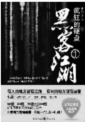
银河九天 著 重庆出版社友情推荐

这两件屁大的事,终究让袁世凯对张之洞产生了误解。张之洞也知道袁世凯对他有误解,而他对袁世凯也有看法。因为袁世凯人品差,口碑坏,不学无术,胸无点墨,却满腹阴谋,擅搞投机。张之洞平生最鄙视这样的人,他自然不会对袁世凯有太多的好感。