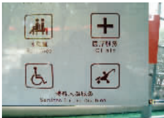
地点:清凉山公园 错误之处:婴儿车的标识下赫然写着“Services for the Disabled”(残疾人服务)