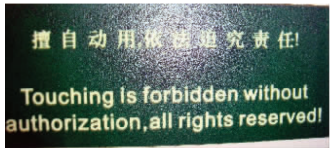
地点:地铁 错误之处:安全设备上的“擅自动用,依法追究责任!”竟被翻译成“Touching is forbidden without authorization, all rights reserved!”(非允许不得触摸,版权所有!)