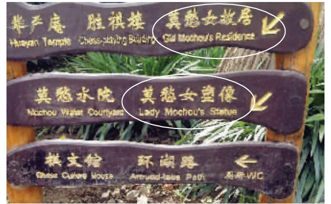
地点:莫愁湖公园 错误之处:两处“莫愁女”分别翻译成“Girl Mochou”(莫愁姑娘)和“Lady Mochou”(莫愁女士)