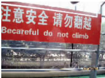
地点:南京市规划建设展览馆 错误之处:“注意安全,请勿翻越”被翻译成“Becareful do not climb!”语法错误