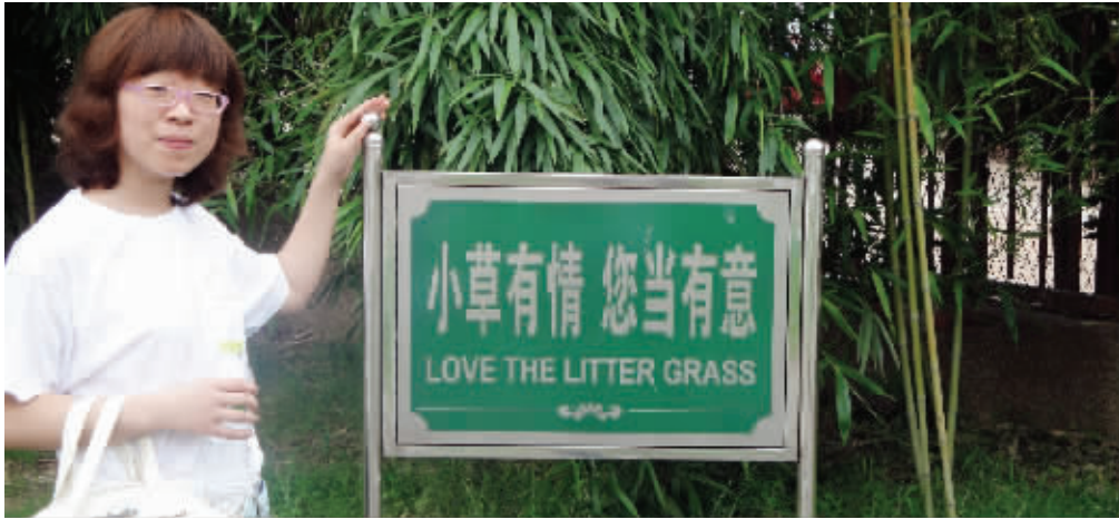
地点:国防园 错误之处:“小草有情,您当有意”被翻译为“Love the litter grass”(热爱垃圾草)