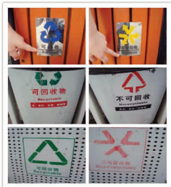
地点:南京城区 错误之处:垃圾桶上“可回收”和“不可回收”的翻译五花八门