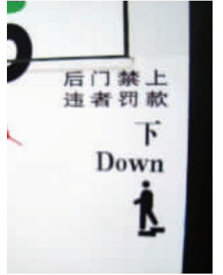
地点:公交车 错误之处:前门标示了“Up”(上面),后门标示了“Down”(下面),不准确。应将上车改为“Enter”,下车改为“Exit”