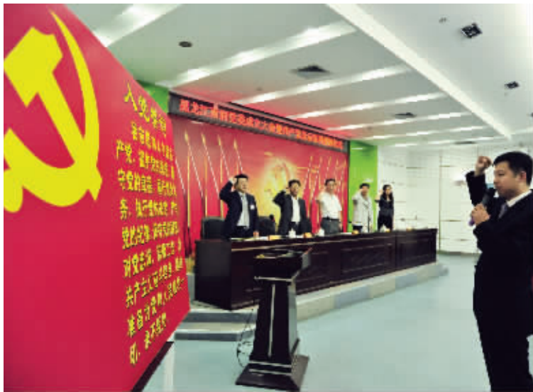
雨润分子公司开展党建活动