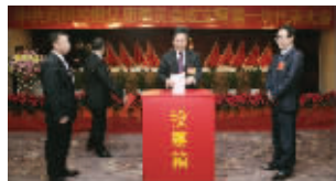
雨润控股集团党委成立大会

2011年9月中旬,首次全国非公有制企业“双强百佳党组织”评选结果发布仪式在北京人民大会堂隆重举行。雨润控股集团党委因其在非公经济党建领域中所取得的突出成绩和贡献,荣获全国“双强百佳党组织”荣誉称号。在发布仪式上,中共中央政治局委员、中央书记处书记、中央组织部部长李源潮亲切会见与会代表,并发表重要讲话。