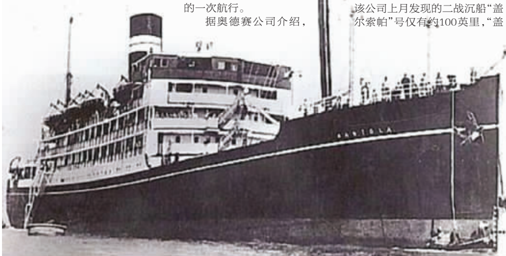
▼“曼陀拉”号资料照片