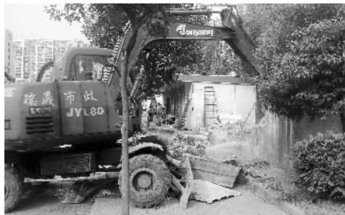
现场挖掘机正在拆违作业 快报记者 曹玉兵