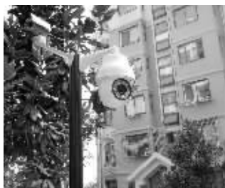
院子东侧路灯杆上的3个摄像头

至于不是这家住户在小区内养鸡引起其他住户不满,这位工作人员称,前一段时间的确有住户反映过这个问题,但前段时间街道工作人员专程来到小区,让这家住户不要在小区里养鸡,所以现在只剩下空鸡窝了。