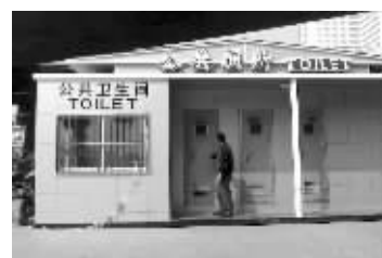
不时有人来上厕所

南京火车站站前广场西侧有一处免费公厕,但此处公厕大门紧闭,没有开放。“公厕建好后不能用,这不是摆设吗?”不少旅客抱怨不已。