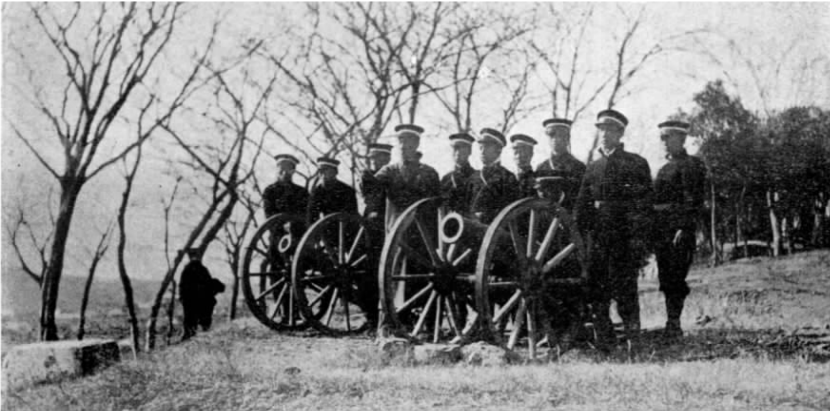
民军占领天堡城后，三炮光复南京

到镇江后，反倒脱出了清军的势力范围，并一举攻占领江旗营，成为镇江都督，统领镇军。