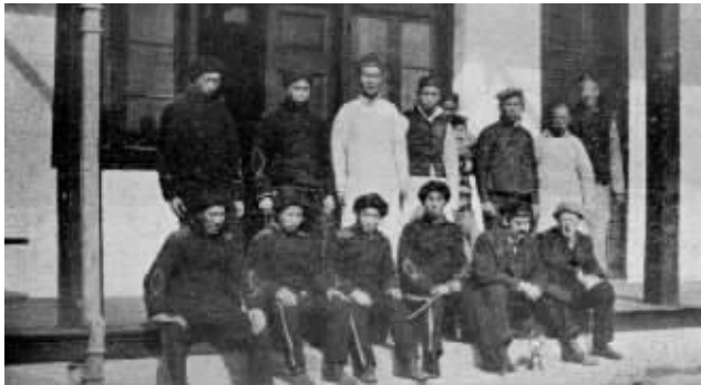
民军占领下关车站