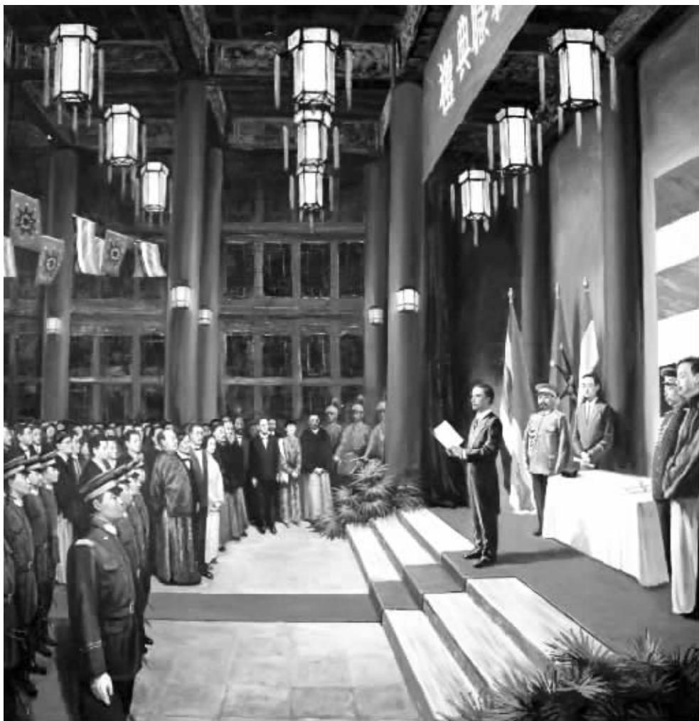
后人创作的油画再现了孙中山宣誓就任临时大总统时的情形,至此,共和在南京初步实现

军第十八协三十六标一营管带,驻守镇江。11月7日,他率领新军起义,宣告镇江光复,成立镇江军政府,被任命为镇江都督。他带兵参加了收复南京战役,第一个攻进南京城,进入两江总督府,被孙中山誉为“收复南京第一功”。