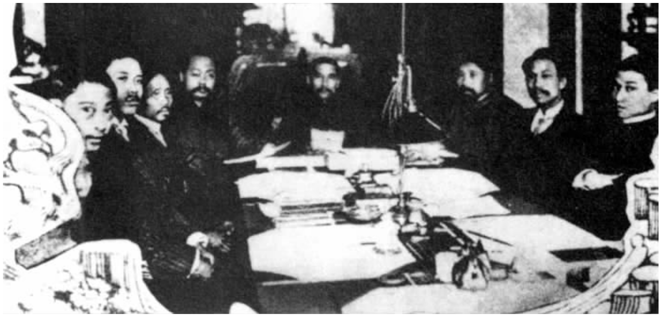
孙中山主持南京临时政府内阁第一次会议,内阁的成立,是共和政体的重要标志之一