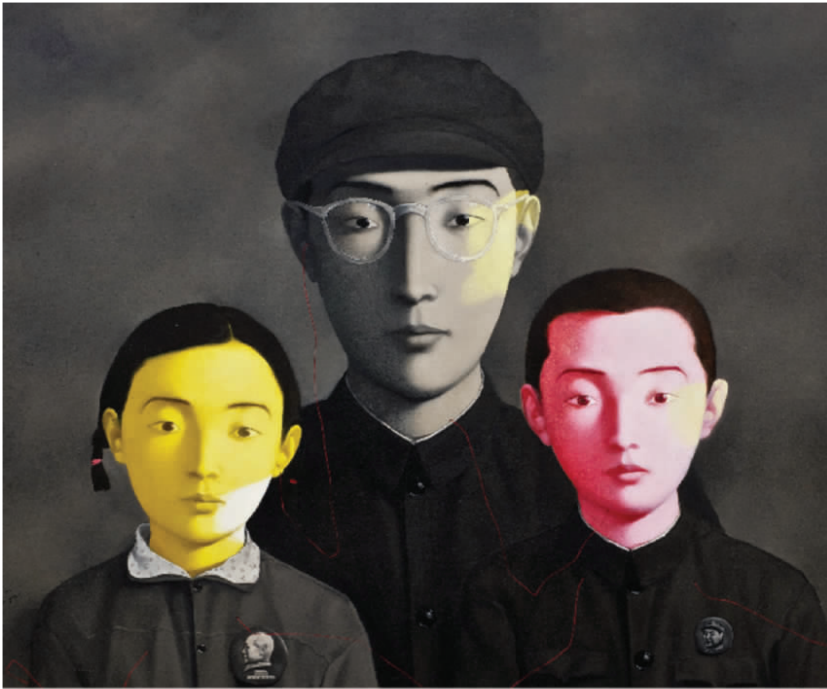
张晓刚《血缘:大家庭一号》