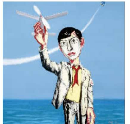
曾梵志《面具系列1998五号》局部

从艺术家个人来看,张晓刚走势仍显凌厉,被称为当代艺术“新F4”的刘小东、刘野、刘炜、曾梵志等四人作品相对具有明显的市场号召力,“新F4”组合的出现,在一定程度上也推动了当代艺术市场格局的变化,创出高价的作品均是具有明显个人“符号化”的作品。从市场格局看,中国当代艺术的整体发展仍有较大发展空间,热门指数与成交额稳步攀升。以刘炜为例,2009年成交均价不足百万,今年春季已突破300万,当代热门艺术家今年内作品成交均价均翻了2-3倍,依然具有投资潜力。