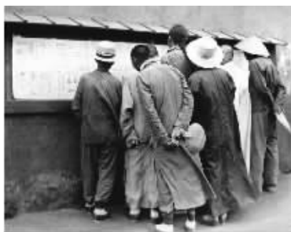
人们从报纸上得知武昌起义的消息

辛亥年农历八月十九日（1911年10月10日）晚，湖北武昌，一支普通的“汉阳造”步枪，射出了一颗决定历史命运的子弹。