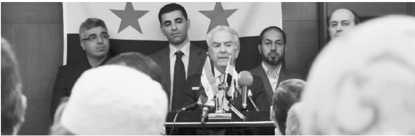
10月2日,叙主要反对派团体在土耳其伊斯坦布尔宣布正式组建政权性质机构“叙利亚全国委员会”