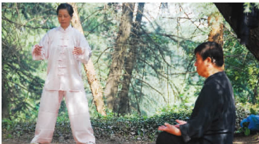
站有站功,坐有坐功,一站一坐,都练气功,各练各的,互不干扰。孰强孰弱,待来年华山之巅再分胜负。9月26日摄于古林公园