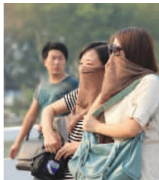
两个美女合围一条围巾,引来旁边男子好奇的目光。这太阳,有木有这么强烈啊? 摄于玄武湖 (作者摄郎获30元话费)