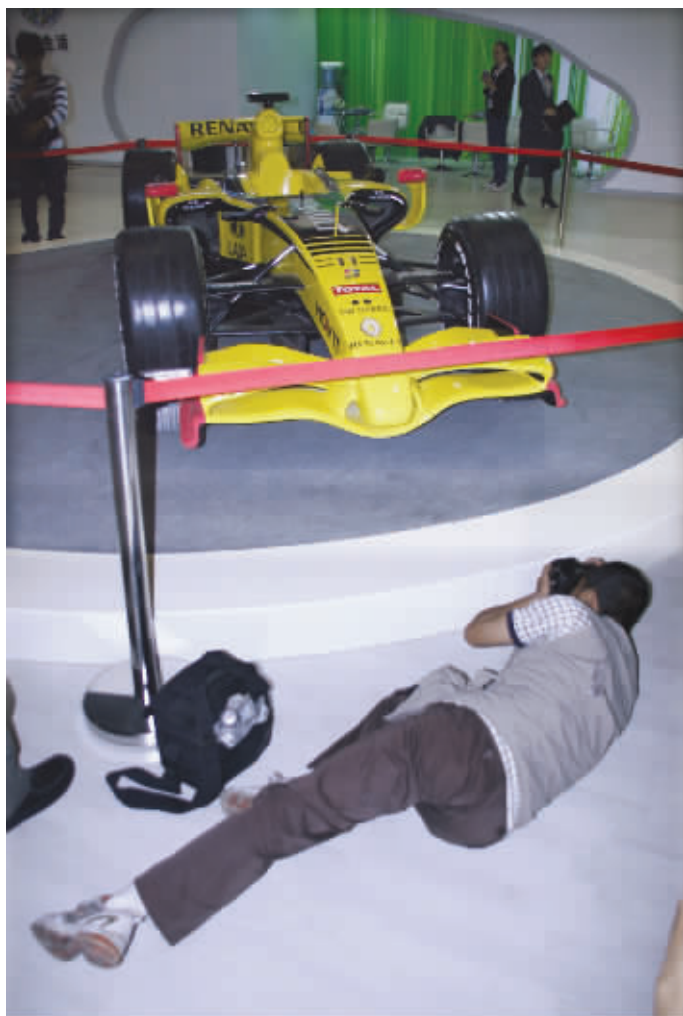
追求好角度,有时就得牺牲形象。看起来,这哥哥真不是为车模来的。9月29日摄于第十届汽车展 (作者小川获30元话费)