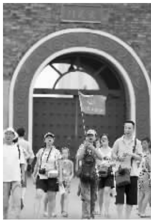
免费开放后的玄武湖公园,吸引了大批游客 (资料图片)

紧挨火车站,免费开放后的玄武湖公园成了来宁外地游客的“首选”。据南京市玄武湖管理处党委副书记王鹤介绍,一年来,玄武湖公园的人流量共计1155万人次,去年同期为290万人次,算下来同期增加了两倍多。双休日平均每天客流在5-6万人,节假日则超过10万人。免票也让这里成了外地旅行团热衷的“实惠景点”。一年