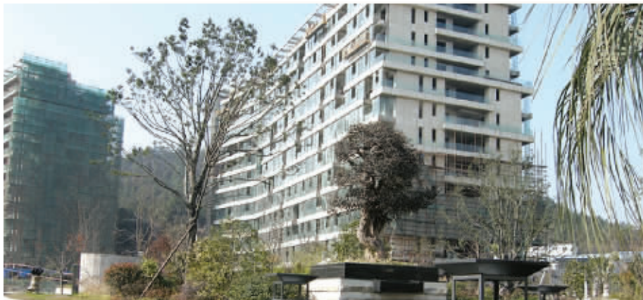
2010年3月,网友拍摄的项目现场