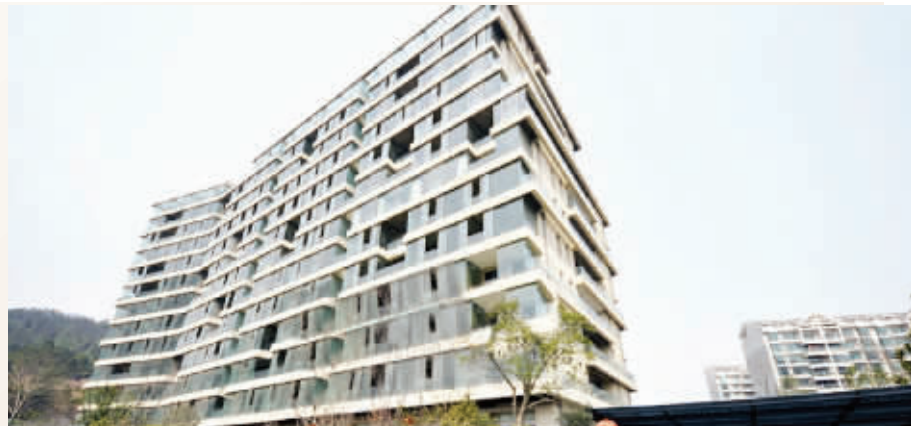
2011年3月,网友再次到现场探营