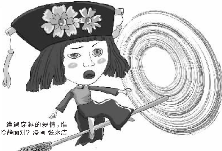
遭遇穿越的爱情,谁能冷静面对? 漫画 张冰洁

★星处方:这位双子座当然比你经历了更多的人生,知道更多的故事,了解更多的东西……更重要的是,他愿意讲这些给你听,并享受那种被崇拜的感觉!我想说的是,双子男的承诺,你居然也敢信?这什么和妻子已经只有亲情没有感情,实在是太没有创意了,作为双子座,说这样的借口,太对不起双子座的脑子……现在想提醒你也许其实狮子座在其它事情上并不叛逆,不过,为了感情,真是可以与全世界抗争到底……但相信你有一天会自己失望后离开。