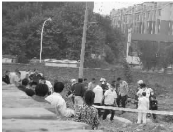
工地内施救现场

抢夺记者手机的人找到了，但勒记者脖子的是何身份却不得而知。昨天下午，记者将该男子的照片交给了社区负责人，他们辨认后表示，照片中的男子不是社区工作人员。随后，记者又将照片发给了铁心桥街道，街道方面表示这名男子不是街道工作人员，怀疑此人可能是工地工作人员。对于此事，快报将继续关注。（蒋先生线索费100元）