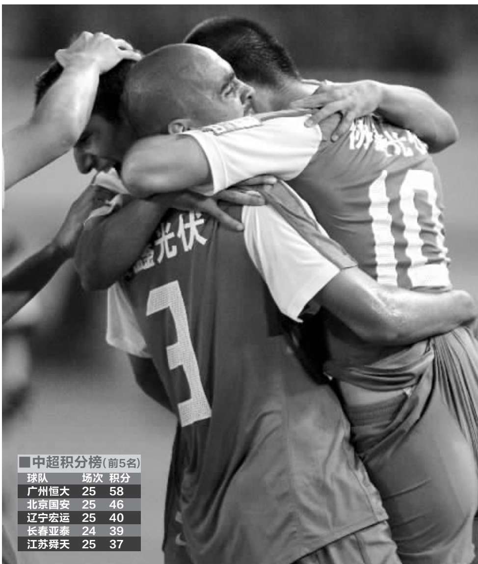
这场胜利来之不易