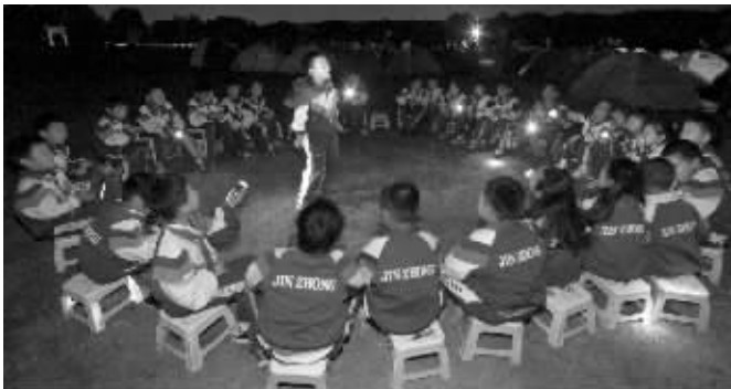
在大草坪上开班会还是第一次

昨天晚上8:30,紫金山下的体育公园草坪上,搭起了100多顶帐篷。214名七八岁的二年级小学生正在看露天电影《动物总动员》,笑得非常开心,他们来自金陵中学河西分校小学部,露营是学校《旅行与观察》课程中“夜宿紫金山”一课,这也是孩子们第一次离开父母,独立在野外过夜。不少父母放心不下:孩子冷不冷?有没有吃饱?会不会尿床?能睡着吗?为让家长消除顾虑,昨天学校开通微博“金陵中学河西分校小学部望星空”,直播现场情况。