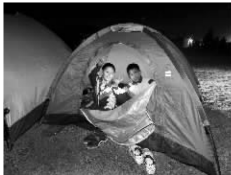
两个人一顶帐篷,孩子们很开心