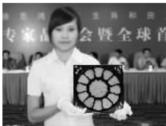
现场发布会上,工作人员展示“徐悲鸿十二生肖福珮大全套”

2011 年 8 月,为迎接 2012 中国千禧龙年,向全世界弘扬中国传统生肖文化,受邀,有着“中国玉雕第一人”尊称的中国玉雕大师袁广如在年过 70 高龄之时,倾毕生精力再创年度绝致力作,首套采用稀有名贵“和田青白玉”为料,以乾隆御用传家之宝“终身如意福珮”为原型,以徐悲鸿传世名画十二生肖图为题创作的《徐悲鸿十二生肖玉珮大全套》震惊问世。