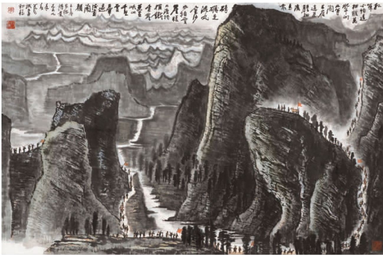
李可染 1959《长征》▲ 成交价1.0752亿元

《长征》乃红色题材突破亿元大关画作，树立了红色经典绘画的新标杆。《长征》为纪念新中国成立十周年以毛主席诗词进行的大型创作初稿，全幅结构规整，笔墨精严。画作中，景物横向展现，重山叠积，如犬牙高低，参差错落，雄奇壮丽。红军队伍沿狭窄山路从左往右横越画面。画家成功地将毛泽东诗词中的革命豪情与浪漫色彩视觉化。画中山体以浓墨重色画成，块面厚实稳重，以留白形成的山路、水道穿插其间。从深浓墨色过渡到留白，色调的明暗变化，平衡了画面厚重的体积感。