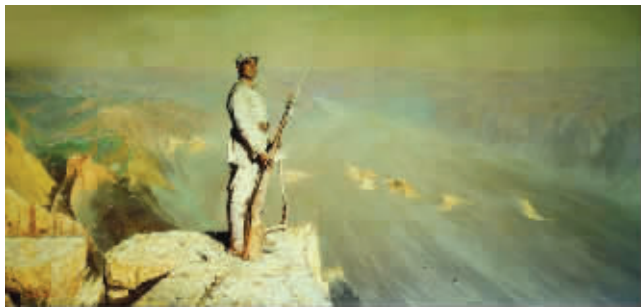
陈逸飞 1972《黄河颂》▲ 成交价4032万元

《黄河颂》是陈逸飞早年成名作中第一幅独立创作的巨幅宽银幕式油画。《黄河颂》的形象塑造注重造型的块面处理和笔触表现；战士的腿部及其立足的岩石等受光面，笔刀兼用，积色较厚，刻画既结实又潇洒；色彩明亮，有着光芒万丈的金光感——这些都完美地体现了陈逸飞所接受的严格的苏联教学体系的技术性训练；同时，陈逸飞善于吸收和转化的敏捷和聪颖，也体现在《黄河颂》的构图经营上。