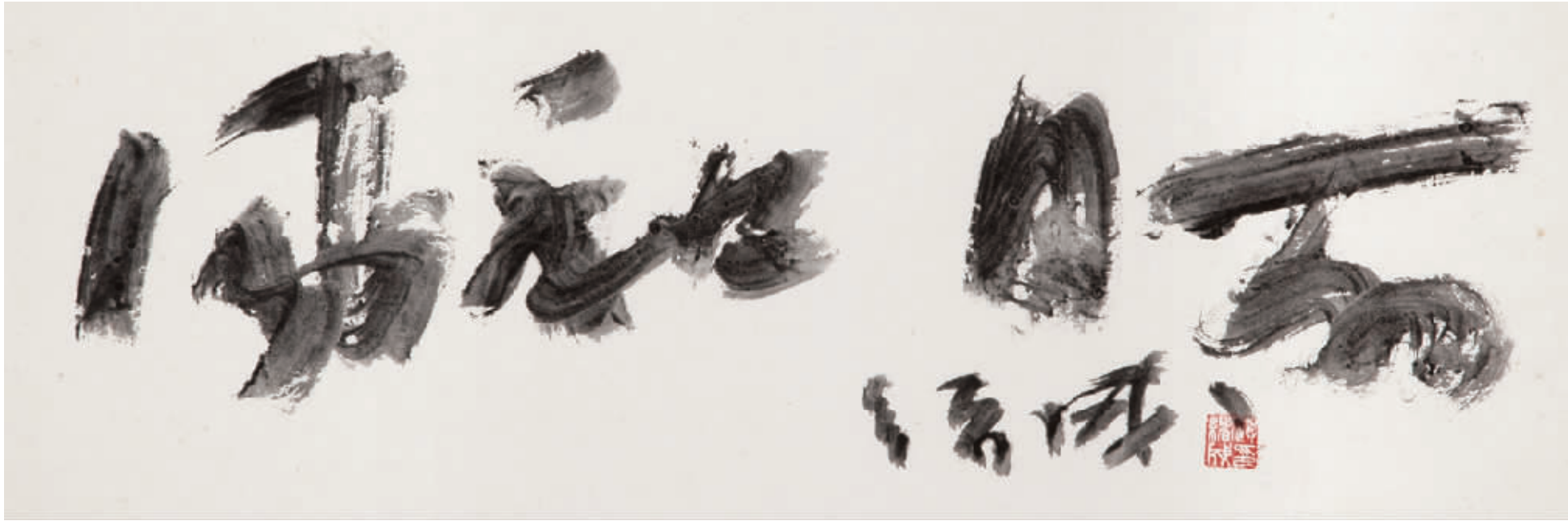
赵绪成作品 风和日丽