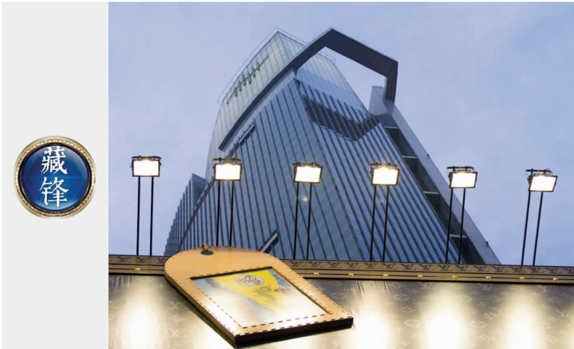
聚光灯下,璀璨的是“星光”,更是智慧的火花 资料图片