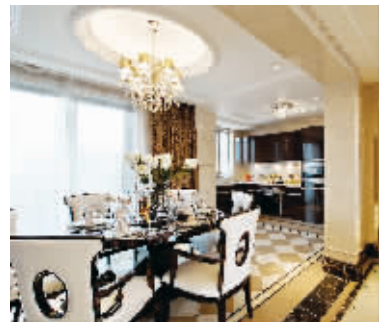
优雅、豪华和最高标准是宋都美域·景上名门的代名词