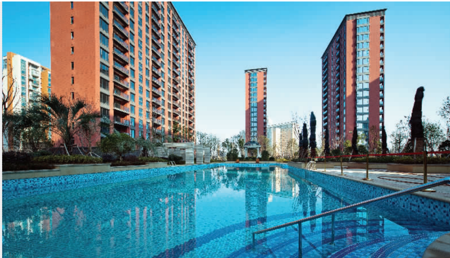
宋都美域·景上名门是按照港式豪宅标准在河西打造的大平层典范作品