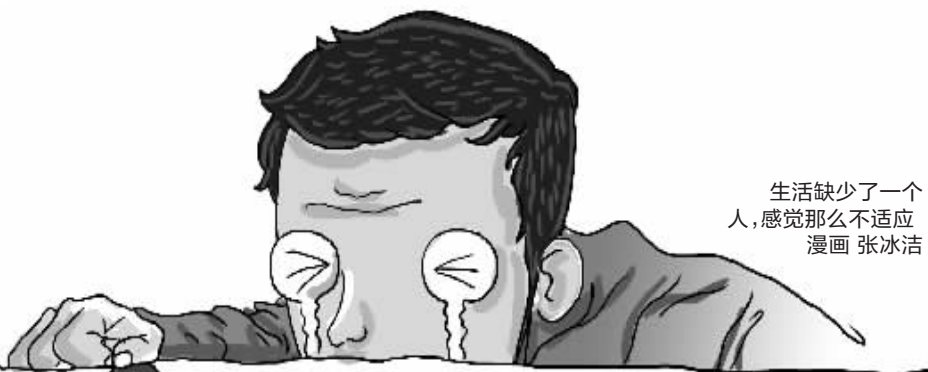
生活缺少了一个人，感觉那么不适应 漫画 张冰洁