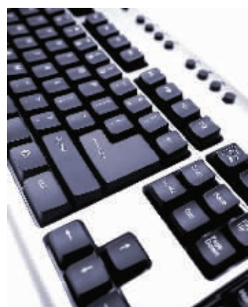
电脑键盘 资料图片

每天早晨登录网络的时候,你会感到互联网带来的便利好像都消失了。你先要输入用户名和密码来启动电脑,然后用另一个密码打开电子邮箱。社交网站、微博自然也需要密码。想在网上书店买本书?登录书店又要一个密码,用信用卡付账则需要另一个密码。这些密码的保护问题曾是IT业不可告人的秘密,但如今密码失窃事件频频发生,计算机科学家们察觉到,密码的替代方案必须浮出水面了。