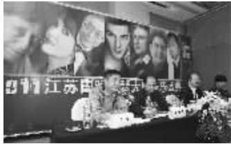
钢琴音乐盛典发布会现场